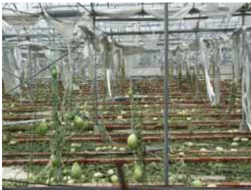
ビニルハウスの被害