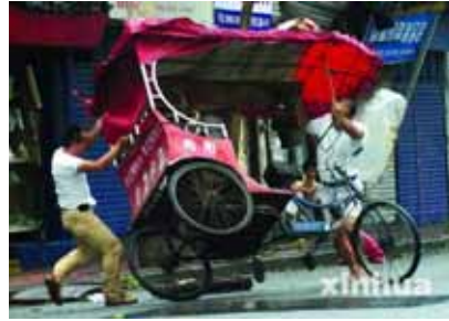
人力車が強風で倒れそう