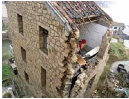
石で建てられた住家の倒壊（現地の従来の家の作り方）