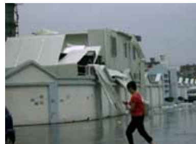
屋根が飛ばされた