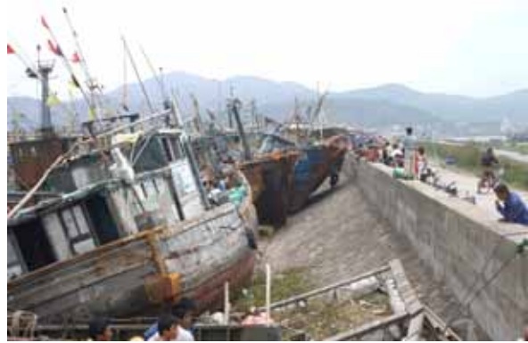
高潮による漁船の被害