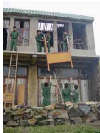
屋根が破壊された