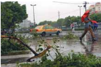
道沿いの木が倒れた