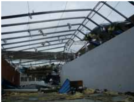
工場の屋根の飛散